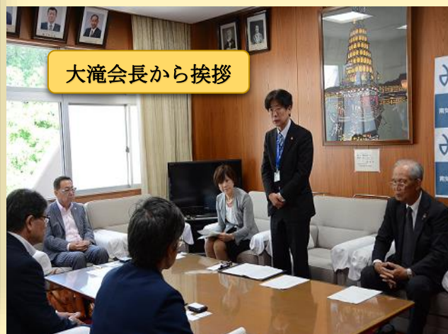
大滝会長から挨拶