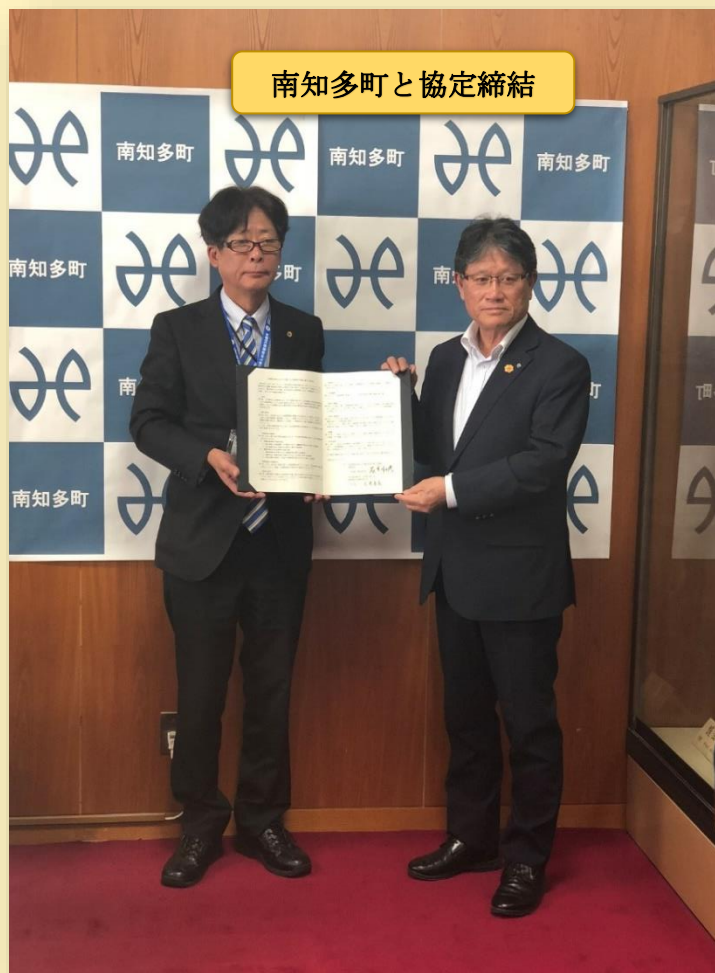
南知多町と協定締結